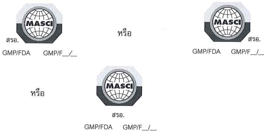
รูปที่ 2 ตัวอย่างการแสดงเครื่องหมายรับรองของสถาบัน (ฉบับภาษาไทย) กรณีผู้ได้รับการรับรองระบบ GMP/FDA (ข้อ 3.)