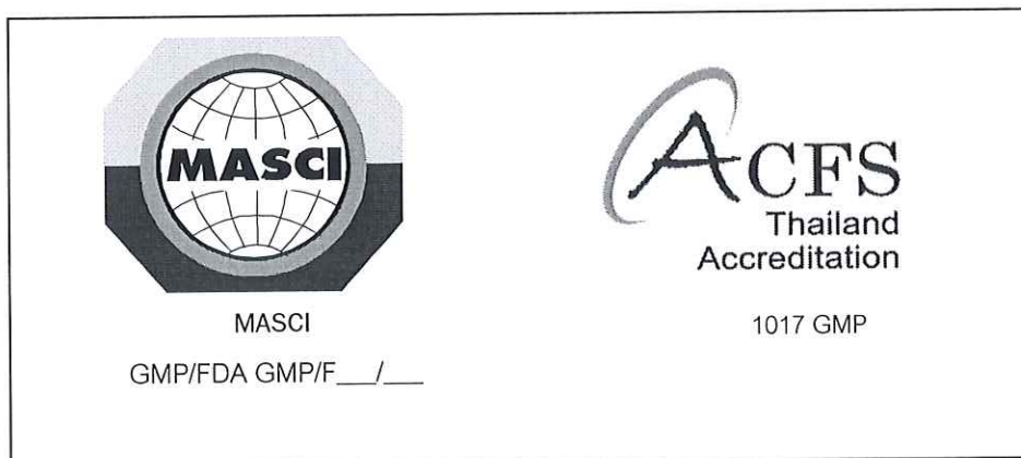
รูปที่ 8 ตัวอย่างการแสดงเครื่องหมายรับรองของสถาบันคู่กับเครื่องหมาย “ACFS” ของ มกอช. (กรณีได้รับการรับรองระบบ GMP/FDA) (ข้อ 10.)